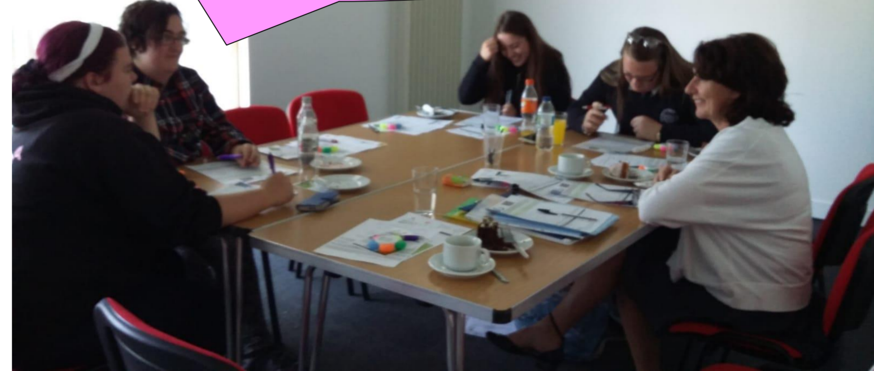
Grŵp Ffocws LLAIS / ADTRAC yn Galeri Caernarfon 26/06/2018